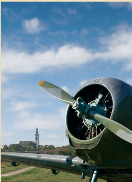
Spomenik Park u Gospođincima