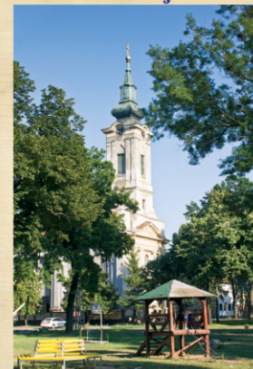
Grko-katolički hram Svetog arhangela Mihaila u Gospođincima